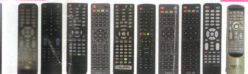
LCD LCD SONIC GENERAL SUNN LCD LCD LED LED-1177 SAMSUNG