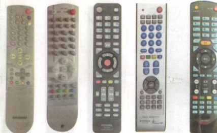
Polaroid KONKA Y67 KONKA Y345 KONKA SINGER & KONKA