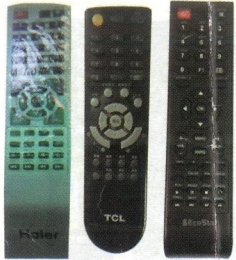
Haier TCL ECOSTAR