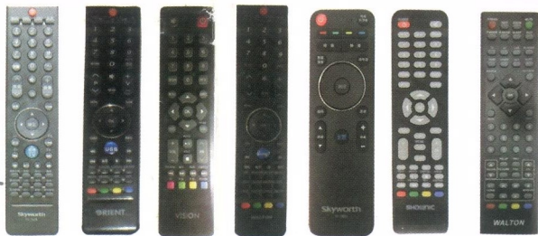
SKYWORTH ORIENT VISION WALTON SKYWORTH SHOWNIC WALTON