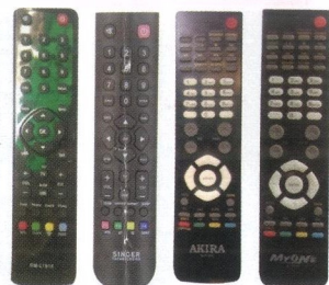
SINGER AKIRA MYONE MYONE