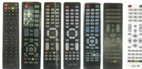
LED LCD LED LED LED LED LED TV