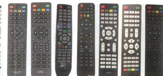
HBT02/03 CTC XY-B01 HBT02 LED LED LED