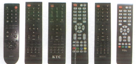
KONKA Haier KTC HTR-T09 ORIENT TCL