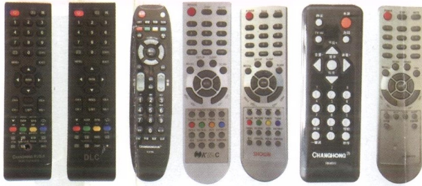
CHANGHONG RUB DLC CHANGHONG KMC SHOWN CHANGHONG CHANGHONG