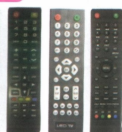
LCD LCD LED LCD